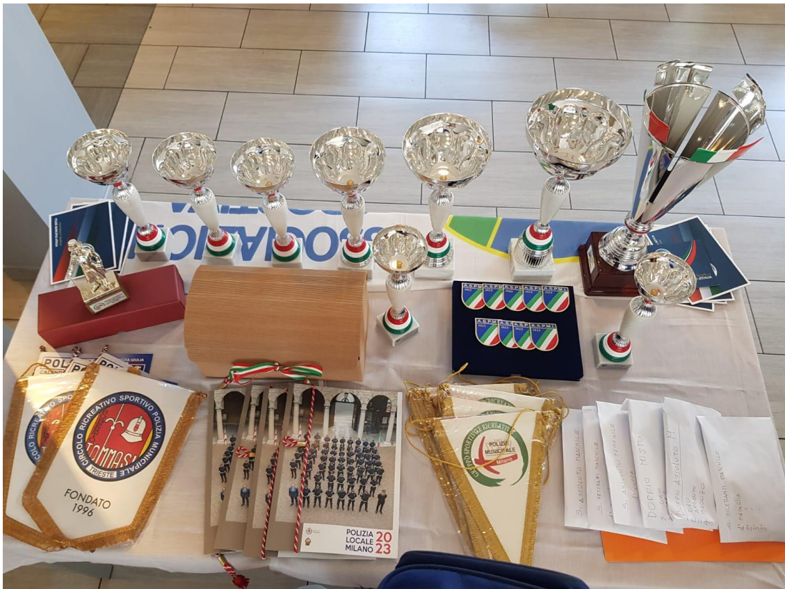
Tavolo Premiazioni foto dall'alto