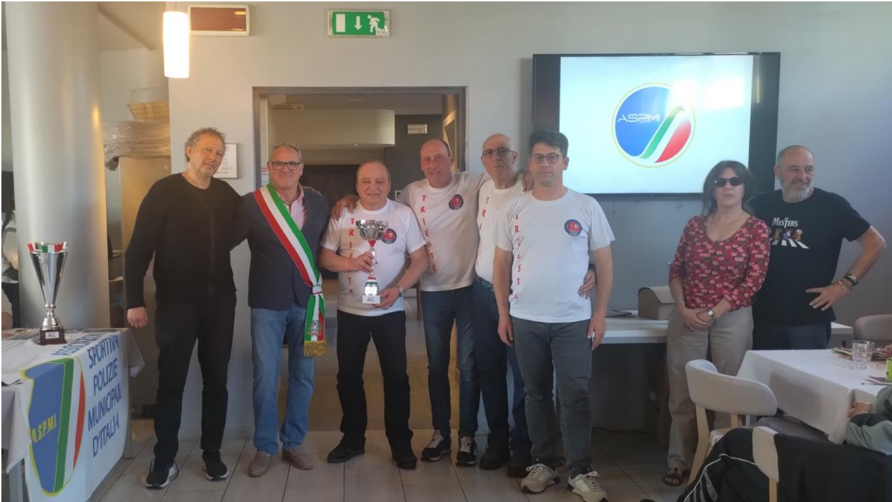
Premiazione del Gruppo Sportivo Trieste 2° Classificato