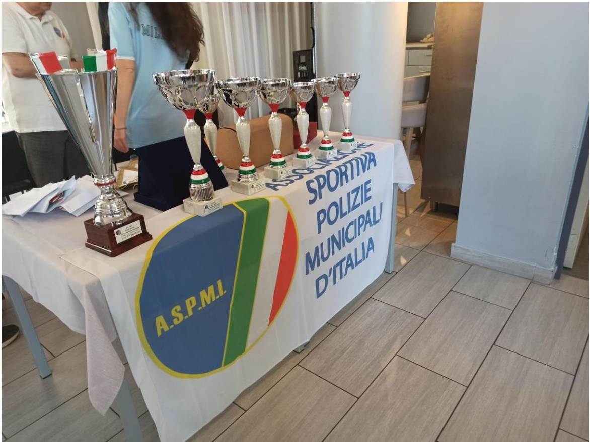
Presso il ristorante Hotel Master - Tavolo Premiazioni