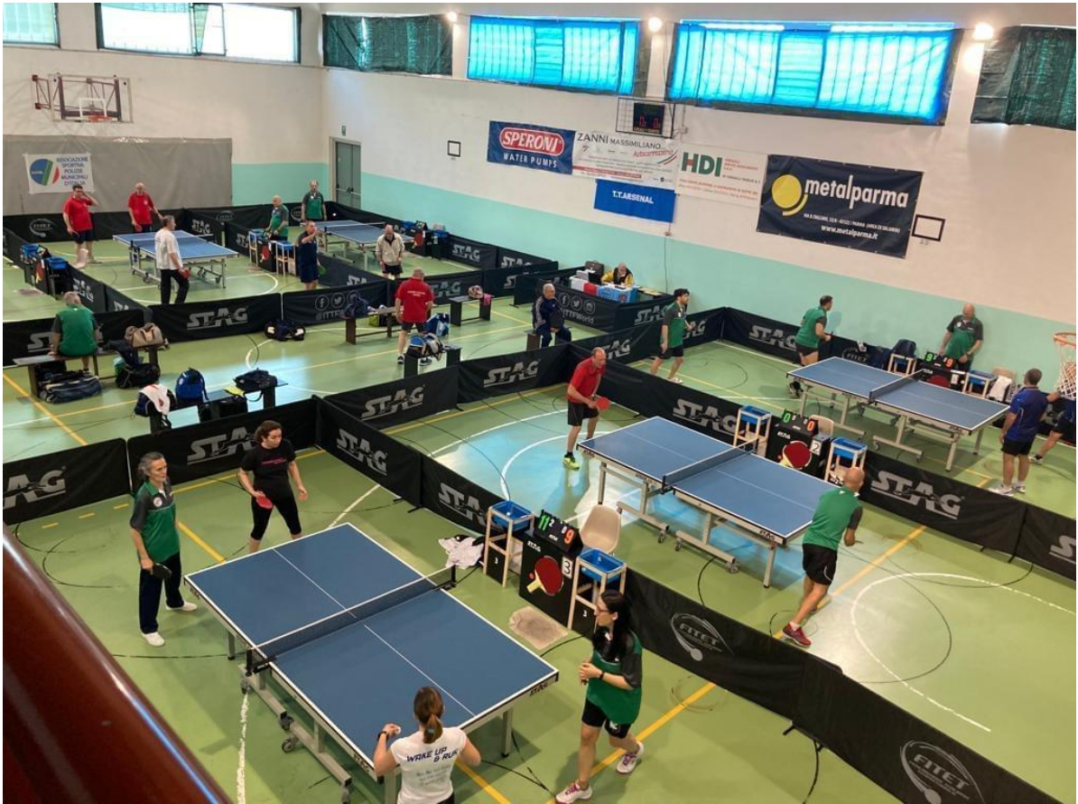
Veduta del campo gara dalla tribuna durante incontri di qualificazione