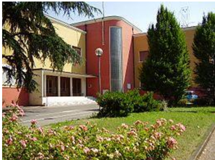
Sede Comune Cadelbosco di Sopra

Grazie per la grande partecipazione a tutti i G.S. che hanno partecipato a questo bellissimo Campionato ASPMI ed , un grande ringraziamento a tutte le persone sia dell'Amministrazione che esterne , che si sono adoperate per la riuscita del Torneo