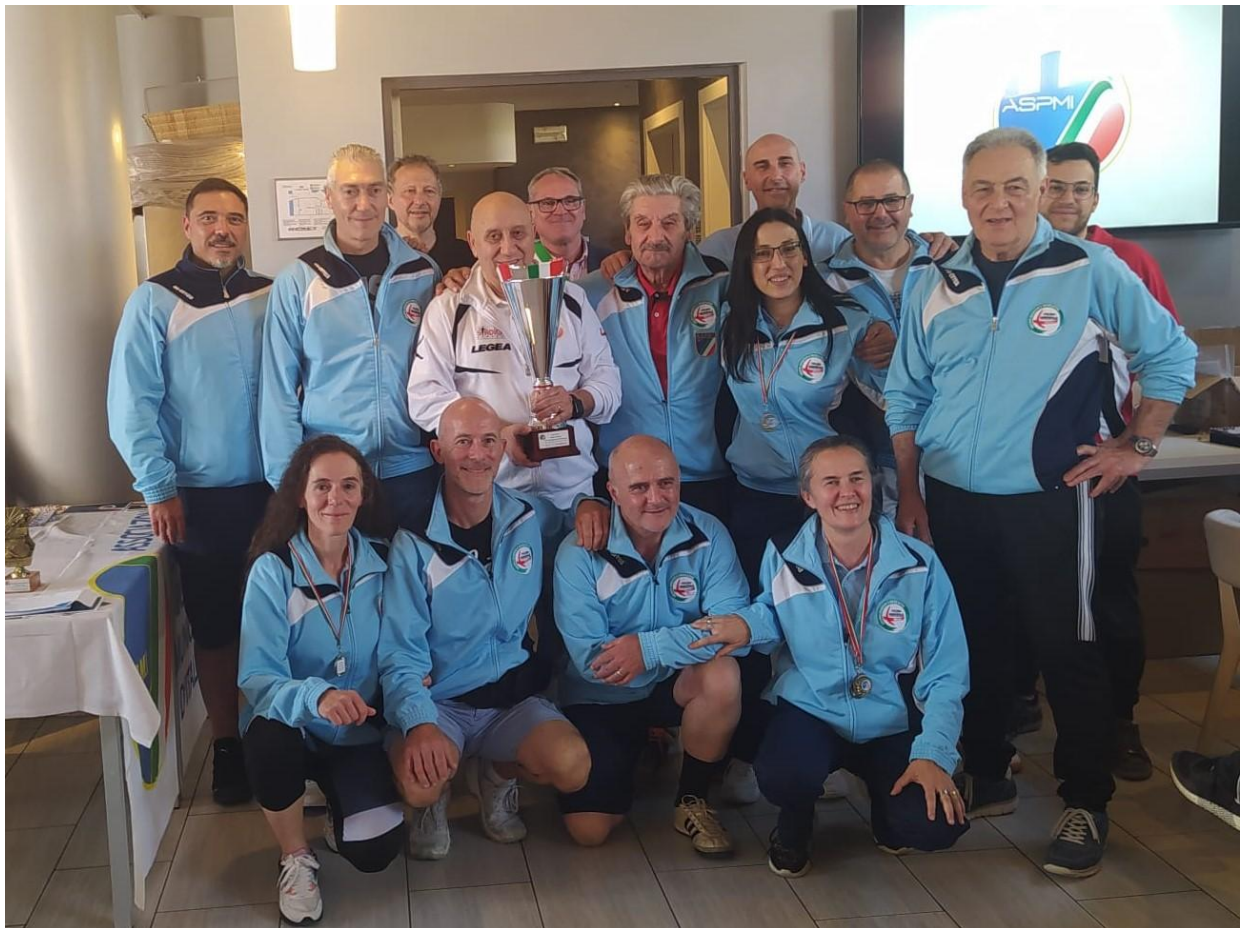
Premiazione Gruppo Sportivo P.L. Milano 1° Classificato - Campione D'Italia a Squadre 2023