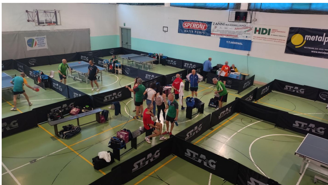
Un momento di pausa dopo alcuni incontri