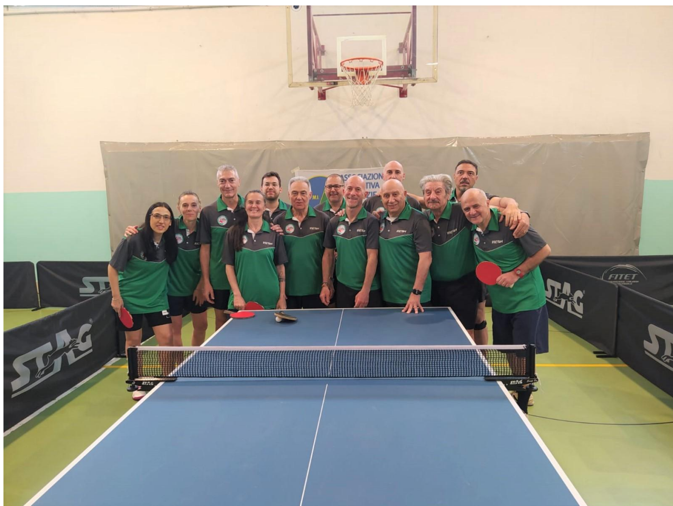
La formazione del Gruppo Sportivo Polizia Locale Milano

Palestra T.T Arsenal Tennistavolo di Cadelbosco di Sopra sede del Campionato ASPMI 2023