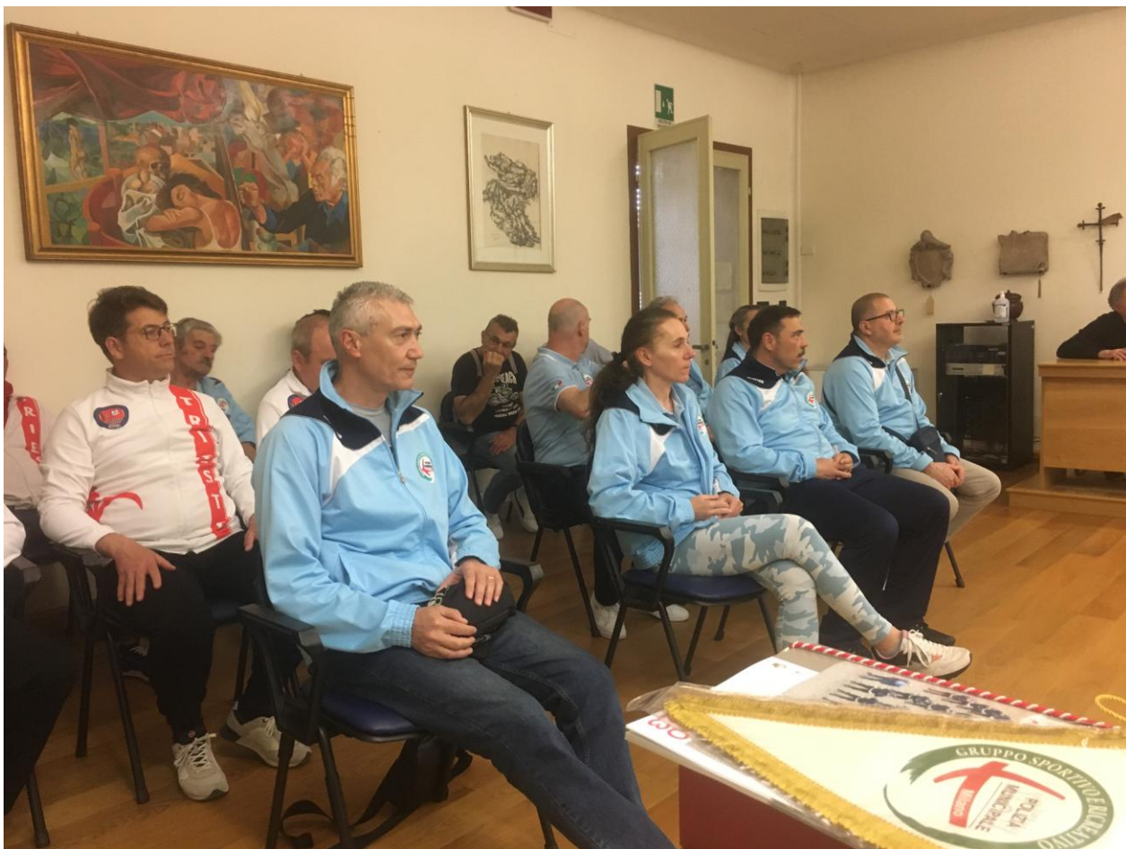
Sala Consigliare, riunione di benvenuto delle Autorità agli Atleti dei G.S partecipanti al Campionato Nazionale ASPMI 2023