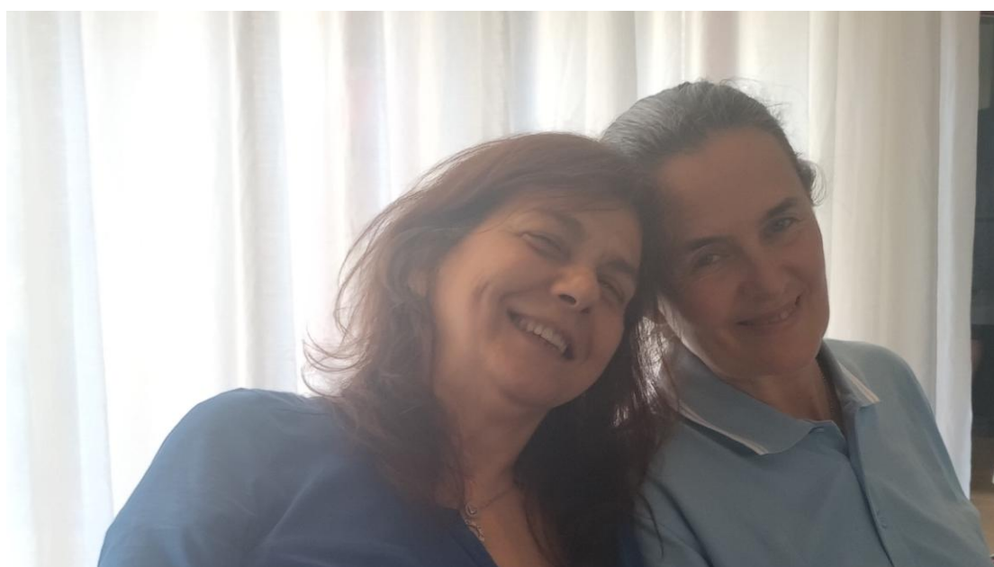
Nadia Rungi ( Fotografa Ufficiale ) – Monica Fresco