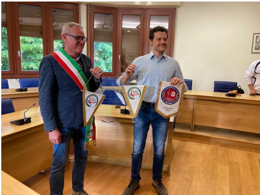
Le Autorità con i gagliardetti dei G.S. di Milano e Trieste