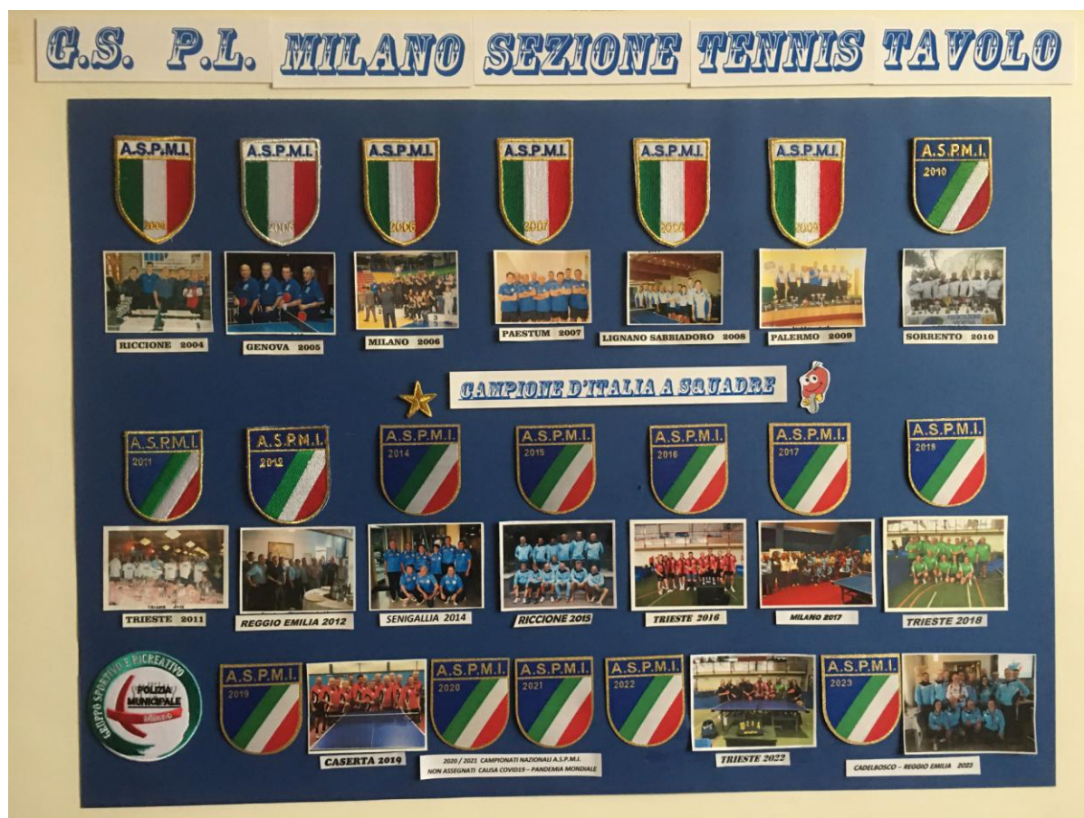
SCUDETTI DI CAMPIONI D'ITALIA GRUPPO SPORTIVO P.L. MILANO DAL 2004 AL 2023